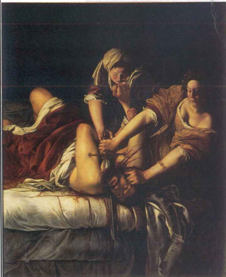
Artemisia Gentileschi (1593-1653), Judith Slaying Holofernes , 1620-1621, 146.5 cm × 108 cm.