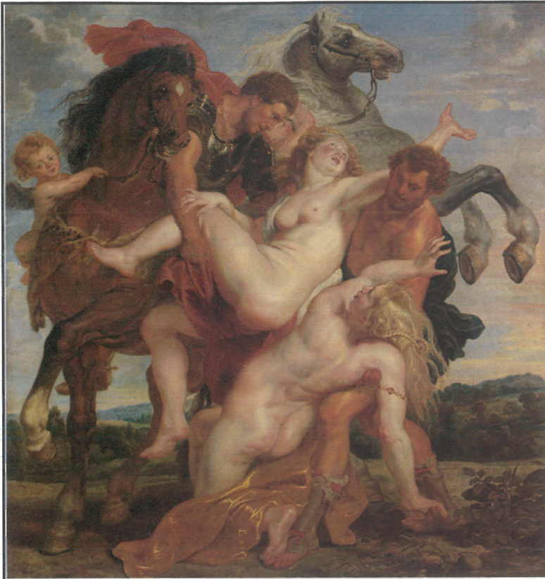
Peter Paul Rubens (1577-1640), The Rape of the Daughters of Leucippus , c. 1618, 224 cm × 209 cm.